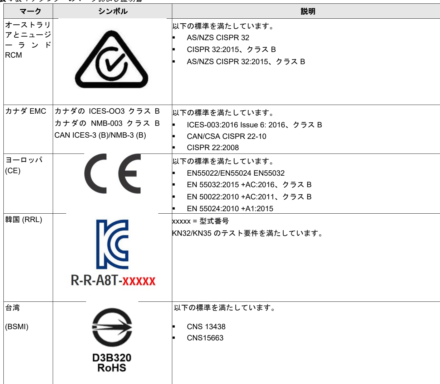
表 4 表 4 アダプターのマークおよび証明書

アダプターの設計と実装は、電磁波放出、無線周波エネルギー感受性、静電気放電の影響を最小化します。