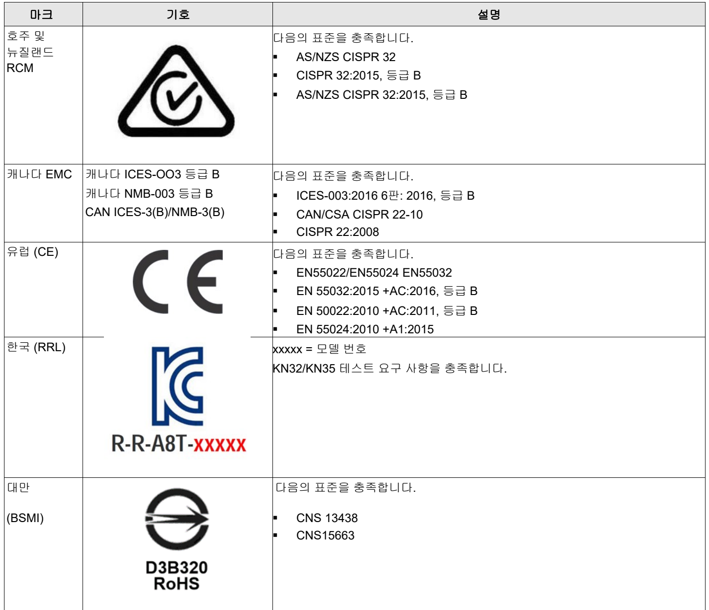
표 4 표 4 어댑터 마크 및 인증

어댑터의 설계 및 구현은 전자기 방사, 무선 주파수 에너지에 대한 감응성 및 정전 방전의 영향을 최소화합니다.