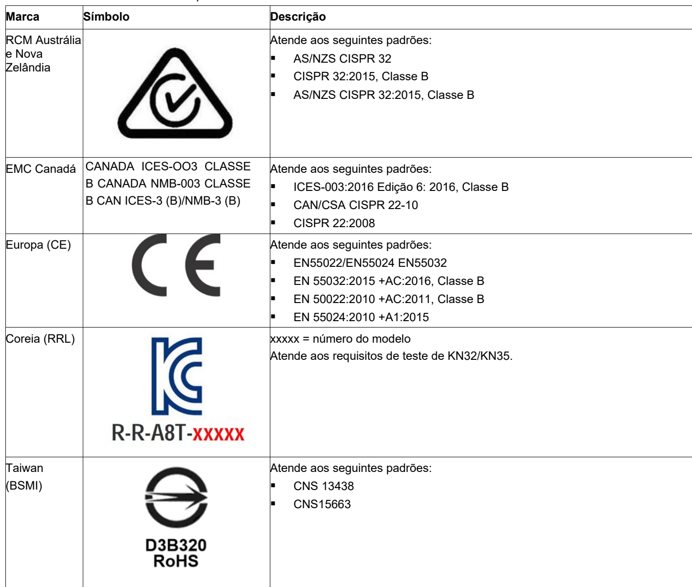
Tabela 4 Marcas e certificados de adaptador

O projeto e a implementação dos adaptadores minimizam as emissões eletromagnéticas, a susceptibilidade à energia de radiofrequência e os efeitos de descarga eletrostática.