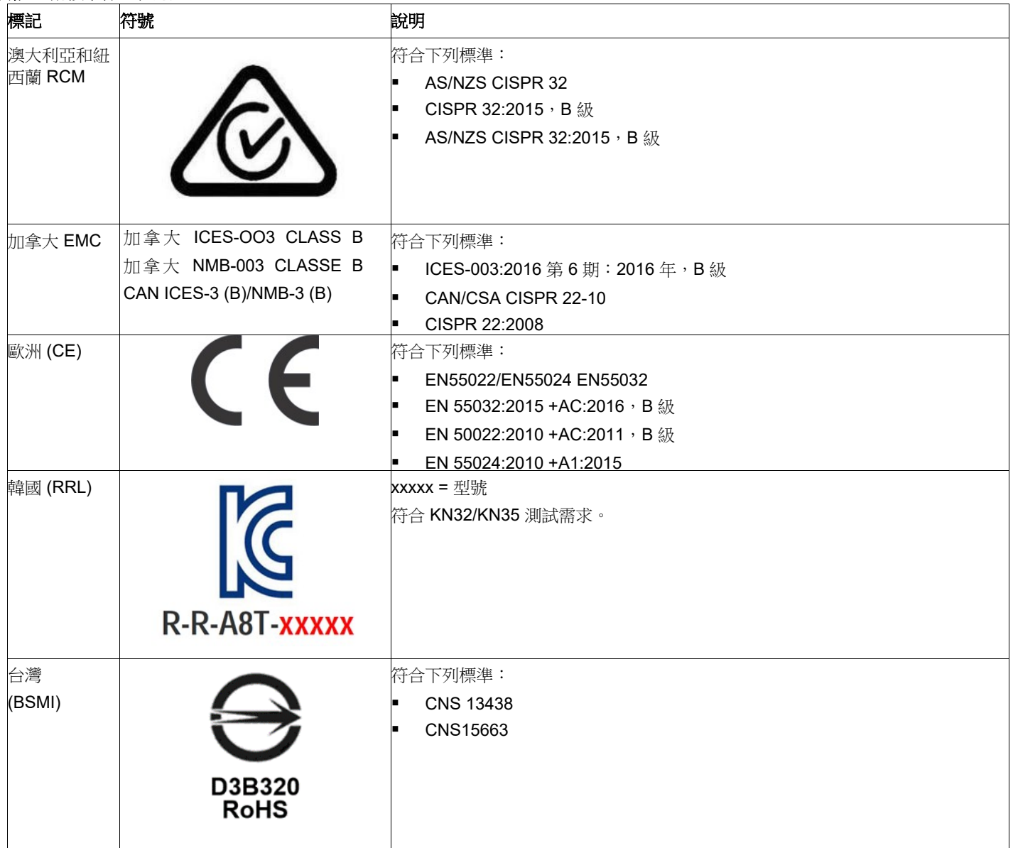
表格 4 配接卡標記和認證

配接卡的設計和實作將電磁放射、無線電波頻率能量的磁化率和靜電放電的影響減至最低。